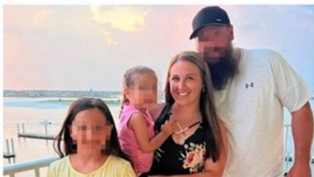
USA: Zweifach-Mutter stirbt an Wasser-Vergiftung: Sie trank 2 Liter in 20 Minuten

Die theoretische Vorhersage stimmt nur insofern mit der klinischen Praxis überein, als eine Hyponatriämie von 136 mmol/l als noch harmlos eingestuft wird: Nach Lu et al. (2020) beginnt die relative Hyponatriämie erst bei 135 mmol/l oder darunter (<135 mmol/l).