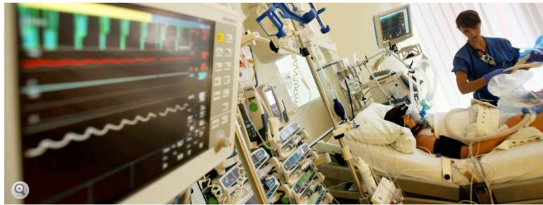
Patient auf Intensivstation: Die Sepsis-Behandlung muss so schnell wie möglich beginnen

Bakterien fluten den Körper, das Immunsystem streikt: An einer Blutvergiftung sterben jährlich rund 60.000 Menschen in Deutschland. Doch nach SPIEGEL-Informationen könnten Tausende Sepsis-Tote noch leben - denn Patienten erhalten rettende Medikamente oft zu spät.